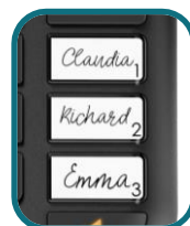
3 teclas de memória direta com cartões de nome na base com fio